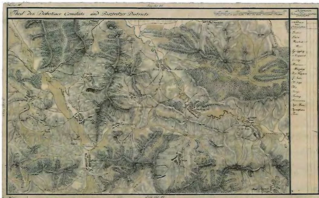
Fig.1. Galații Bistriței în Harta Iosefină a Transilvaniei, 1769-73